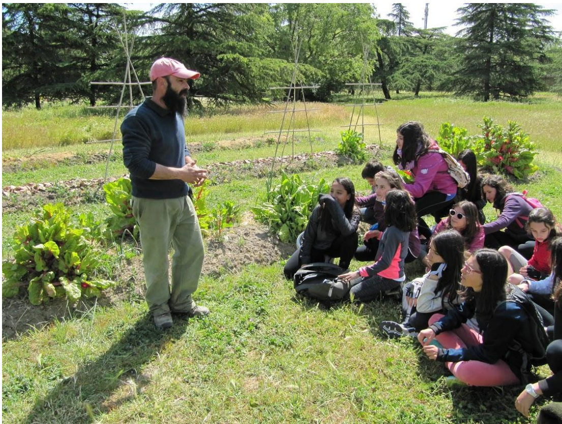
Visita al Huerto Ecológico Torre Arias

Por último, como actividad aglutinadora de todo lo realizado en los tres proyectos y en los departamentos a lo largo del curso, el acto de inauguración del “Huerto Berta Cáceres”, al que asistieron los siguientes representantes: