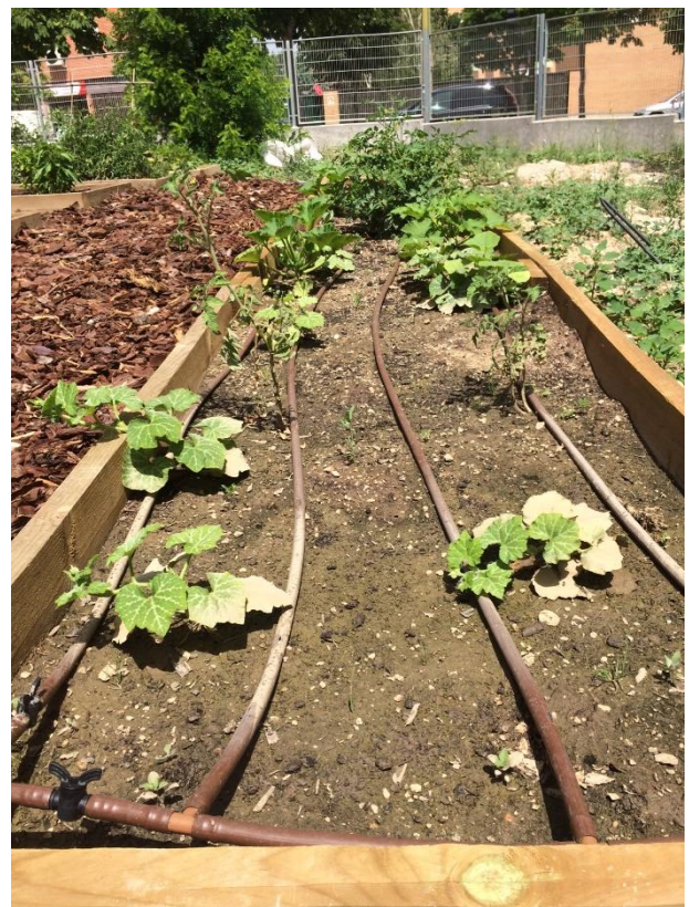
Instalaciones del Huerto (2016/17)