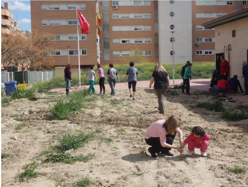
Aspecto de la parcela del Centro en el inicio de la intervención del curso 2015/16

Ese trabajo previo tuvo básicamente cinco fases de actuación