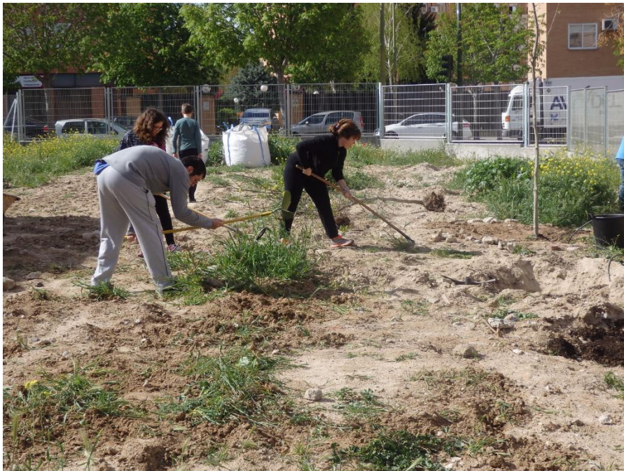
Aspecto de la parcela del Centro en el inicio de la intervención del curso 2015/16

Así comenzó en el curso 2015/16 un proyecto, embrión del que este último curso hemos llevado a cabo, el de ajardinamiento de parte de la parcela del centro.