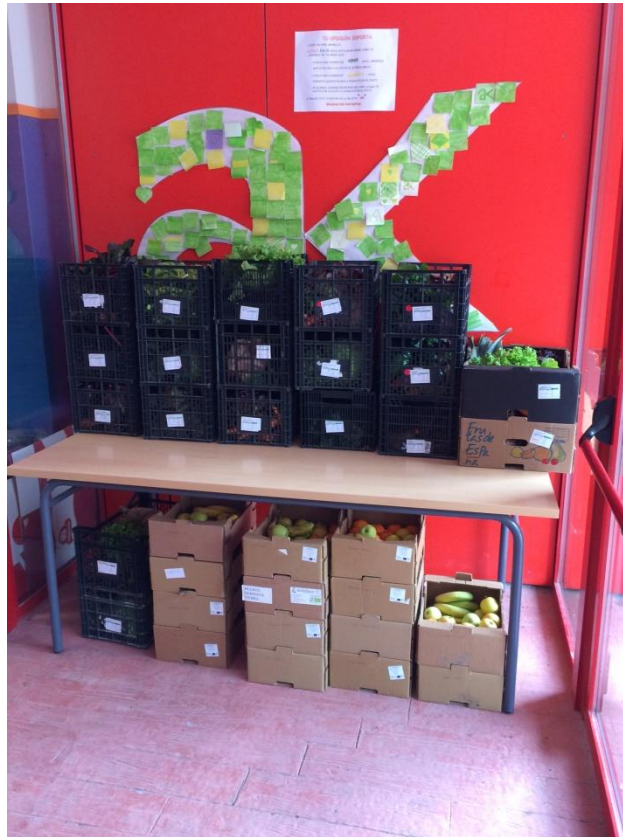
Punto de reparto de Cestas Ecológico Solidarias en el AK.

Se ha realizado un recetario con verdura, al que han aportado recetas, con algún significado personal, profesoras, profesores y familias del Centro (se adjunta el recetario como anexo).