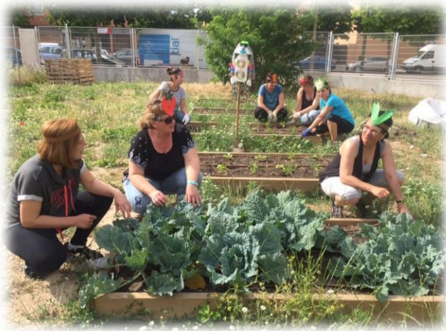
Jornada festiva de "La Hortaliza"

Se han tenido dos sesiones festivas, aprovechando la participación de los niños de primaria que venían de las familias con hermanos mayores en el Centro. Algunas madres construyeron diademas con figuras de hortalizas.