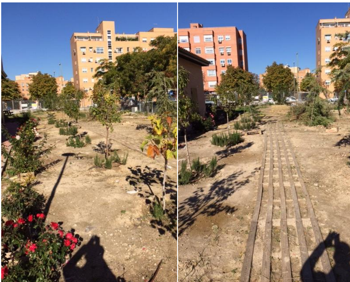
Aspecto de la parcela del Centro en el inicio del presente curso escolar (2016/17)