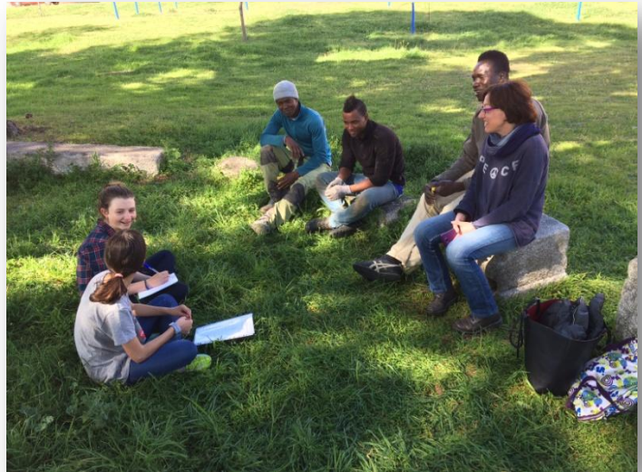
Visita al Huerto Hermana Tierra del grupo de alumnos y profesores del proyecto APS