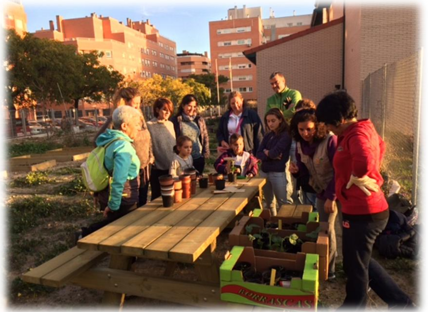
Tareas de plantado del huerto de invierno (2016/17)

Creo que merece la pena poner en valor esta actividad, aunque no ocupe el espacio específico del huerto, por lo que supone de transformación del entorno a través de la participación, pues se han finalizado las tareas de ajardinamiento del curso pasado con la instalación de la malla geotextil alrededor del huerto y el jardín y el resultado es realmente llamativo.