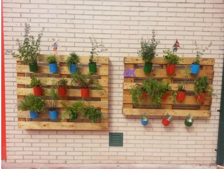
Jardines verticales realizados con palés y latas de tomate

Igualmente se han emprendido talleres con material reciclado para completar el huerto: construcción de espantapájaros, uso de cajas de fruta para alcorques, uso de palés para caminos y jardines verticales.